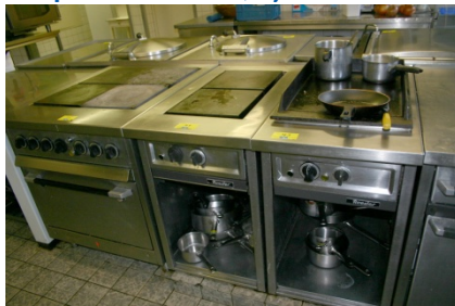
2-Platten-Herd ROEDER, Bj. 77