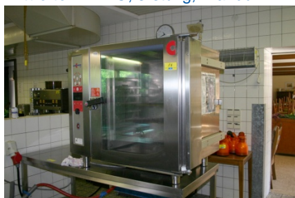
Konvektomat CONVOTHERM VSP 10/10, 15-18 kW, Handbrause, ca. 20 Bleche u. Schalen