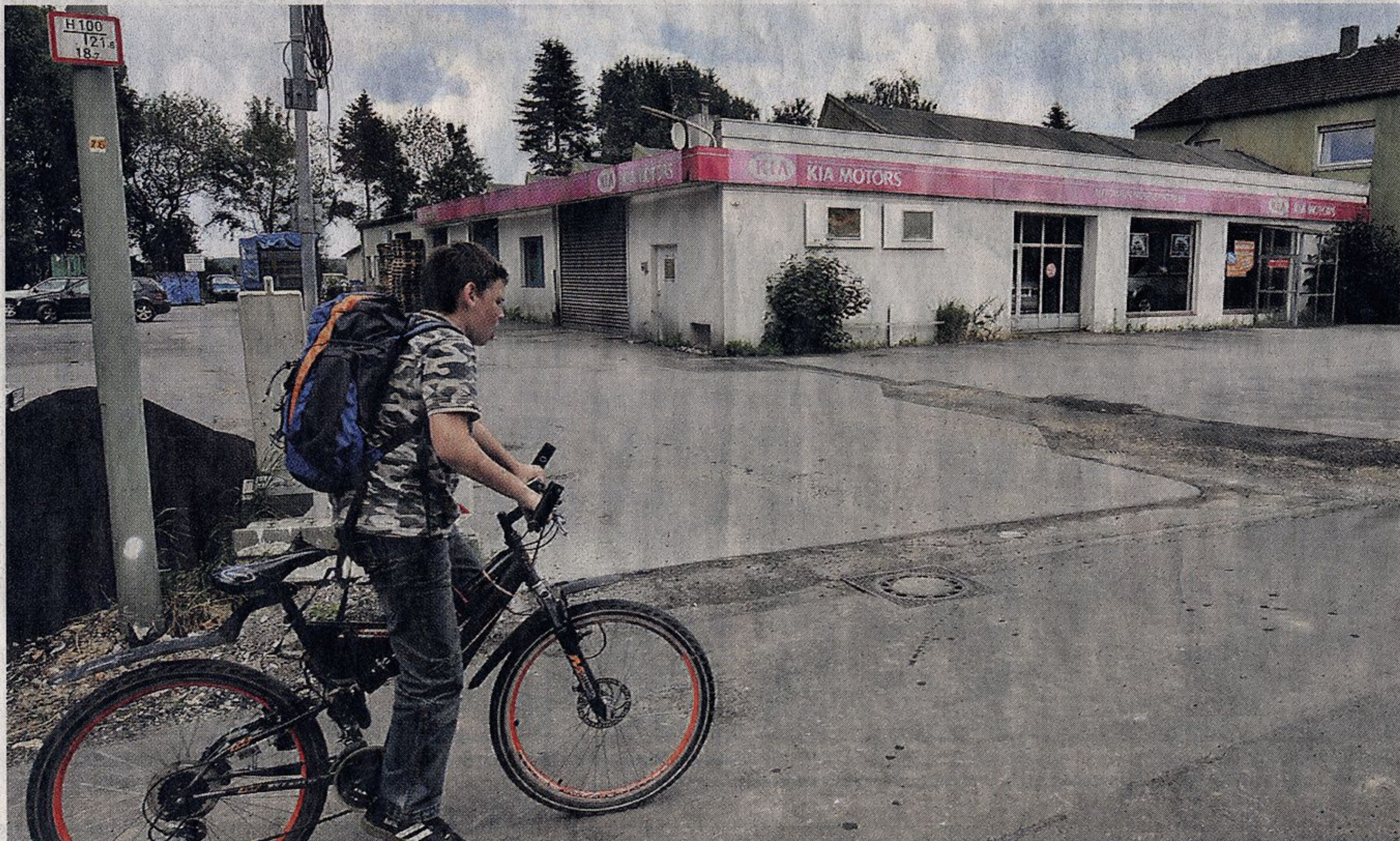
Verlassen und irgendwie vergessen: Im Kia-Autohaus der Autex Handels GmbH bewegt sich (erstmal) nichts mehr.

Autex Handels GmbH hat vorläufig Insolvenz angemeldet. Morgen kommt das Inventar unter den Hammer